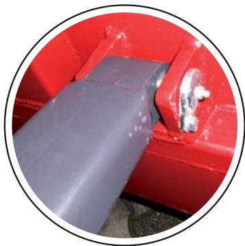
Drehpunkt mit Schmiernippel