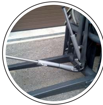
2 Zylinder System Abkippwinkel 90°