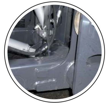
Aussteifung für hohe Nutzlasten