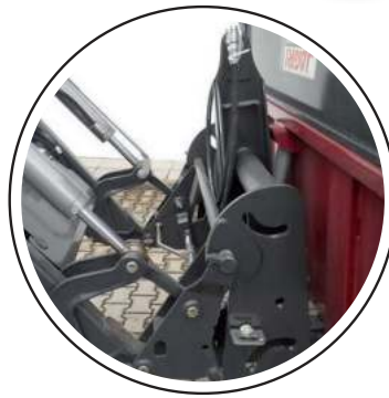
Euro Aufnahme serienmäßig